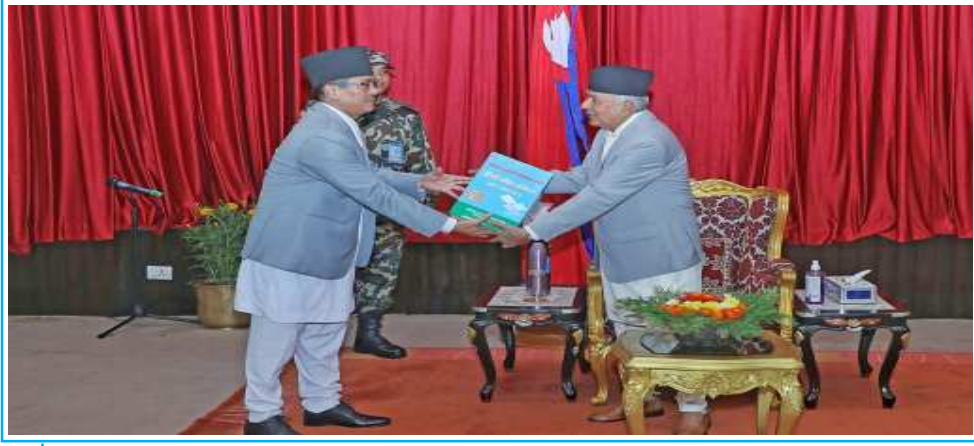
जलेश्वरटुडे समाचारवाता काठमाण्डौं, १५ असोज