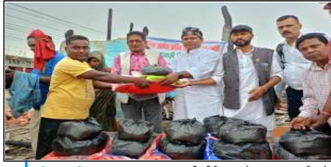
जलेश्वरटुडे समाचारवाता जनकपुरधाम, ४ जेष्ठ

धनुषाको कमला नगरपालिका-५ का अग्नी पीडितलाई सपोर्ट नेपालले राहत सामग्री वितरण गरेको छ। आइतबार विहान घटनास्थलमै पुगेका सपोर्ट नेपालका पदाधिकारी र कर्मचारीहरुको टोलीले अग्नी पीडितलाई राहत सामग्री वितरण गरेको हो।