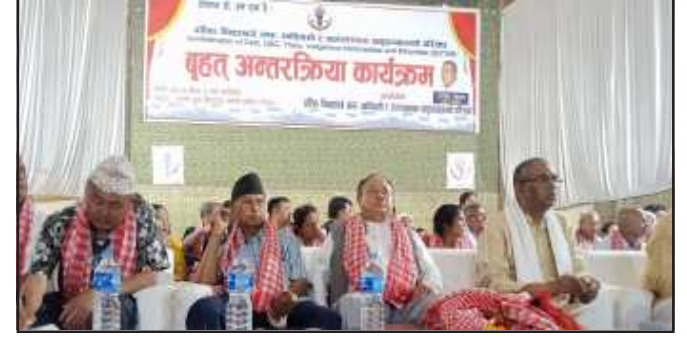
जलेश्वरटुडे समाचारवाता विरगंज, ४ जेष्ठ

जनता समाजवादी पार्टी नेपालले हालै गठन गरेको केन्द्रीय परिसंघले देशको सबै उत्पीडित समुदायलाई समेटेर बृहत् अन्तरक्रियासहितको खबरदारी सभा आयोजना गरेको छ।