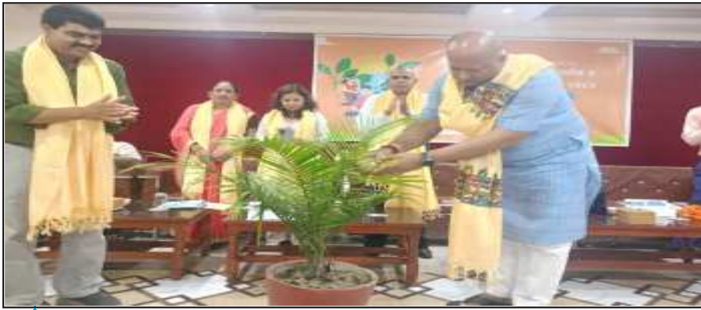
जलेश्वरटुडे समाचारवाता धनुषा, २५ आषाढ