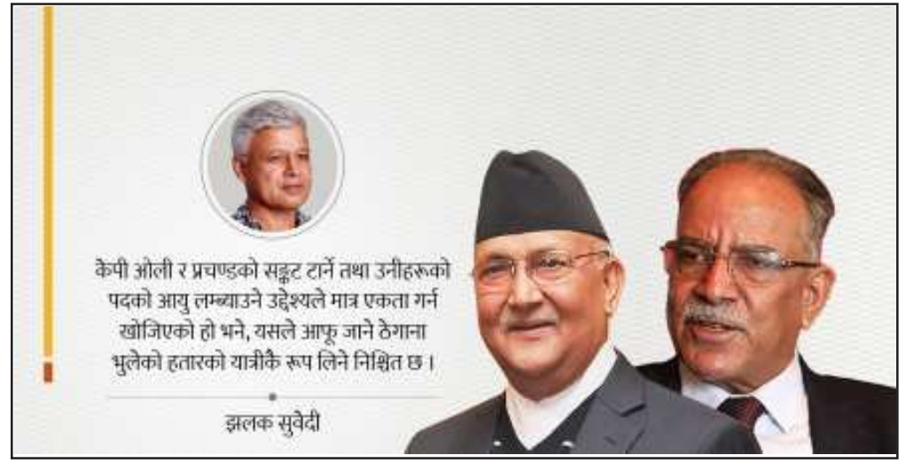
केपी ओली र प्रचण्डको सङ्घट टार्ने तथा उनीहरूको पदको आयु लम्ब्याउने उद्देश्यले मात्र एकता गर्न खोजिएको हो भने, यसले आफू जाने ठेगाना भुलेको हतारको यात्रीकै रूप लिने निश्चित छ ।

एकता आवश्यक रहेको कुरामा सहमत हुँदाहुँदै पनि यस्तो एकता विकल्प हो कि नयाँ वामपन्थी विकल्प (न्यु लेफ्ट अल्टरनेटिभ) अथवा अल्टरनेटिभ लेफ्ट आवश्यक हो भन्ने विषय पनि बहसमा आउनु जरुरी छ ।