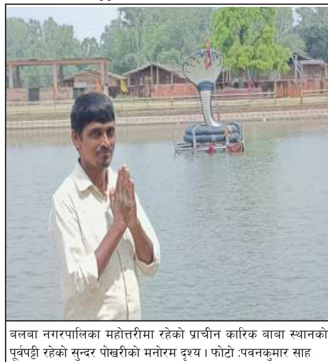
बलवा नगरपालिका महोत्तरीमा रहेको प्राचीन कारिक बाबा स्थानको पूर्वपट्टी रहेको सुन्दर पोखरीको मनोरम दृश्य।

प्रकाशक तथा सम्पादक : पवन कुमार साह, सह-सम्पादक : सोनी साह, मुद्रक : जय दुर्गा अफसेट प्रेस, जनकपुरधाम