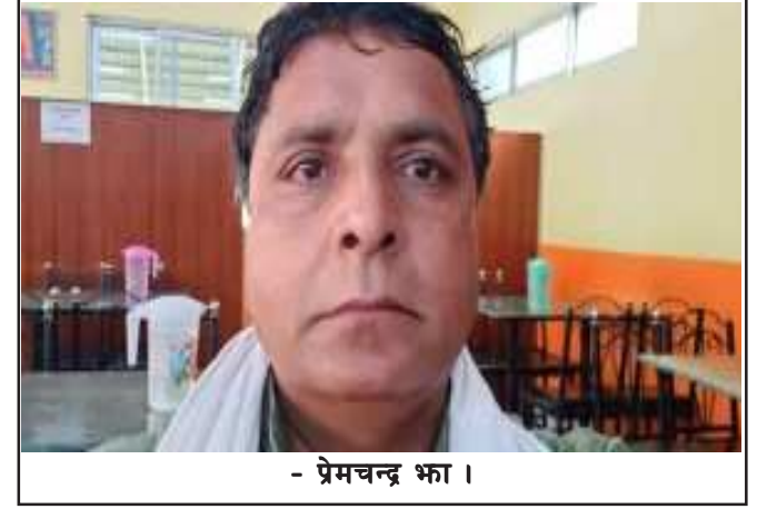
- प्रेमचन्द्र भ्ना ।

संरचनामा निर्भर रहनुपरेको अवस्था छ। भ्रष्टाचारका मुद्दा, श्रम विवाद, बाल अधिकारसम्बन्धी संवेदनशील विषय वा उपभोक्ता अधिकार उल्लंघनका घटनामा न्याय खोज्न देशका विभिन्न भूभागबाट नागरिक काठमाडौं आउन बाध्य छन्। यसले आर्थिक, सामाजिक तथा मानसिक रूपमा ठूलो बोझ सिर्जना गरेको छ। दूरदराजका नागरिकले एउटा मुद्दाको सुनुवाइका लागि पटकपटक काठमाडौं धाउनुपर्ने अवस्था न्यायमा समान पहुँचको सिद्धान्तसँग पूर्ण रूपमा मेल खाँदैन। संविधानले समान अवसर र न्यायिक पहुँचको प्रत्याभूति गरे पनि संरचनागत सीमितताका कारण व्यवहारमा असमानता देखिने गरेको छ। यस विषयमा अपेक्षाकृत कम बहस हुनु र पर्याप्त ध्यान नजानु पनि चिन्ताको विषय हो। यदि सेवाग्राहीको सुविधालाई केन्द्रमा राख्ने हो भने विशेष अदालत, श्रम अदालत, बाल अदालत तथा उपभोक्ता अदालतजस्ता संस्थाहरूको सेवा विस्तार प्रदेशस्तर वा क्षेत्रीय स्तरसम्म पुऱ्याउने विषयलाई प्राथमिकताका साथ उठाउनुपर्छ। वर्तमान संघीय व्यवस्थाले पनि यस्ता सुधारका लागि पर्याप्त आधार प्रदान गरेको छ। संघीयताको मूल मर्म भनेकै अधिकार, स्रोत र सेवा नागरिकको नजिक पुऱ्याउनु हो। त्यसैले भविष्यमा विशेष प्रकृतिका अदालतहरूलाई प्रदेशस्तरमा विस्तार गर्दै लैजाने नीति अवलम्बन गरिनुपर्छ। यसले काठमाडौं केन्द्रित न्यायिक भार घटाउनुका साथै देशका सबै नागरिकलाई तुलनात्मक रूपमा समान अवसर उपलब्ध गराउनेछ। यसै सन्दर्भमा काठमाडौं जिल्ला अदालतको क्षेत्रगत सेवा विस्तारलाई केवल एउटा प्रशासनिक निर्णयको रूपमा मात्र होइन, न्यायिक सुधारको प्रारम्भिक संकेतका रूपमा पनि हेर्न सकिन्छ। अवश्य पनि यस्तो निर्णय अघि बढाउँदा पर्याप्त अध्ययन, कानुनी विश्लेषण, पूर्वाधार मूल्यांकन तथा सरोकारवालसँग व्यापक परामर्श