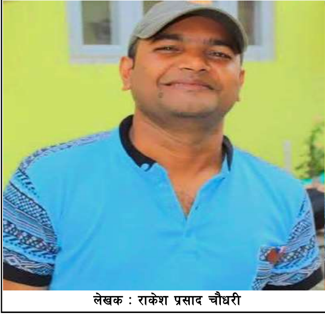
लेखक : राकेश प्रसाद चौधरी

संस्कृत ? प्राकृत ? अपभ्रंश र अवहट्ट र आधुनिक आर्य भाषाहरू : यसले देखाउँछ कि अवहट्ट स्वतन्त्र रूपमा अचानक बनेको भाषा होइन; यो अपभ्रंशको अन्तिम विकासक्रम हो। अवहट्टको प्रयोग विशेषतः